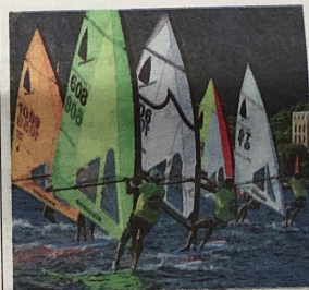
I mondiali A Mondello sono in corso di svolgimento i campionati del mondo classe windsurfer

tragico, era un sabato, mentre eravamo in acqua si diffuse la notizia dell'attentato di Capaci a Falcone. Tra l'altro molti vip e artisti che stavano venendo da noi rimasero bloccati in autostrada. Annullammo tutto, competizioni, concerti e la sfilata con modelle. Ma una festa di villa Wirz, che non dipendeva da noi, si fece lo stesso. Ricordo le polemiche al "Maurizio Costanzo