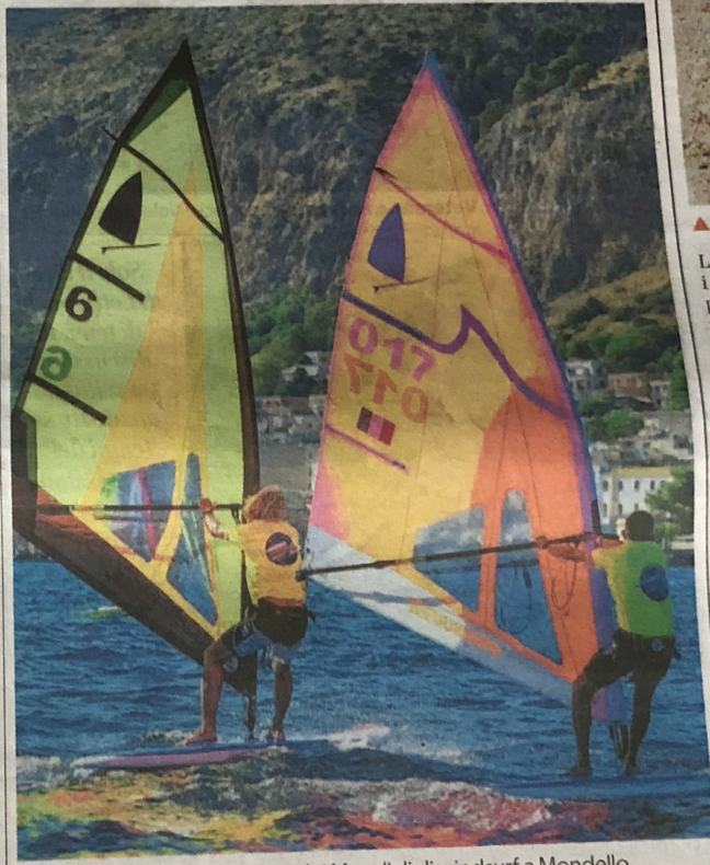
▲ Vecchie glorie Una regata dei Mondiali di windsurf a Mondello

Intervista al presidente del club Albaria