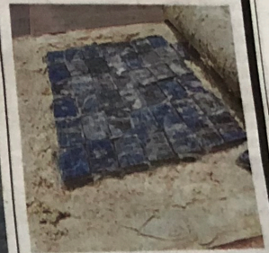
▲ Il sequestro La coca scoperta

Un fiume di cocaina per l'Isola hub dei narcos